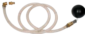
Kit d'aspiration 1" pour cuve enterrée Code 355251

Appareil destiné à la filtration des eaux domestiques. Possibilité de purger le filtre pour éliminer les impuretés.