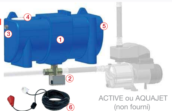
ACTIVE ou AQUAJET (non fourni)