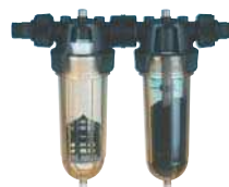
Filtre NW 25 DOUBLE Code 506090

Collecteur et filtre universel s'installant facilement sur le bas des descentes de gouttière. Rejette les impuretés (feuilles, mousses...) par l'avant et alimente en eau de pluie la cuve GLOBUS.